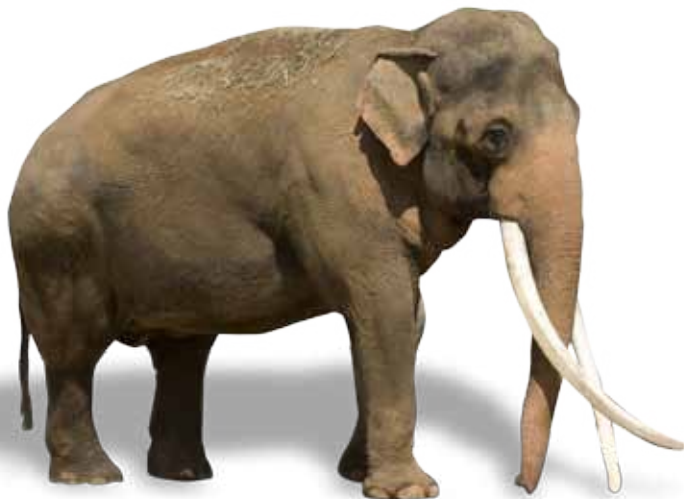
Ασιατικός ελέφαντας ( Elephas maximus )