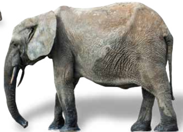
Δασόβιος αφρικανικός ελέφαντας ( Loxodonta cyclotis )